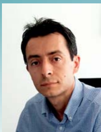
Başkan Πρόεδρος Chairman