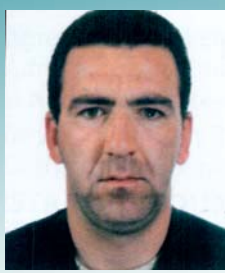
D.K. Üyesi Μέλος Ε.Ε. A.B. Member