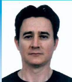
Başkan Πρόεδρος Chairman