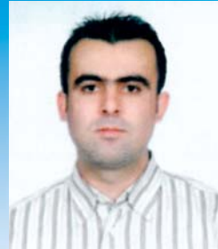
Genel Sekreter Γενικός Γραμματέας Secretary General