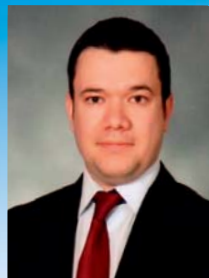
Υ.Κ. Üyesi Μέλος Δ.Σ. Board Member