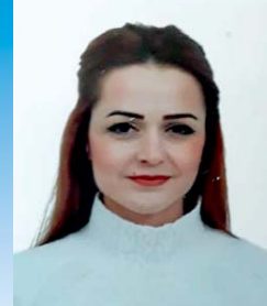
Υ.Κ. Üyesi Μέλος Δ.Σ. Board Member