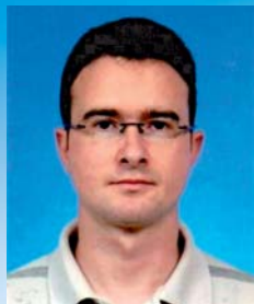
Υ.Κ. Üyesi Μέλος Δ.Σ. Board Member