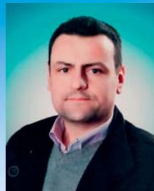
Asbaşkan Αντιπρόεδρος Vice - Chairman