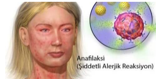
Anafilaksi (Şiddetli Alerjik Reaksiyon)

Anafilaksi hayatı tehdit eden sistematik bir reaksiyondur. En çok besinler, ilaçlar ve arı sokmalarına bağlı olarak gelişir. Çok hızlı gelişir ve hemen müdahale gerektirir. Klinik bulguları deride kızarıklık, sıcaklık hissi, nefes almada güçlük, hışırtılı solunum, tansiyon düşmesi, çarpıntı ve şok şeklindedir.