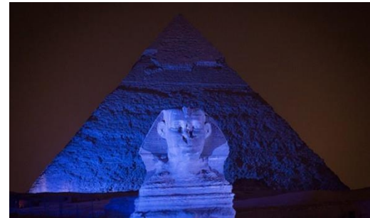
Giza Keops Piramidi