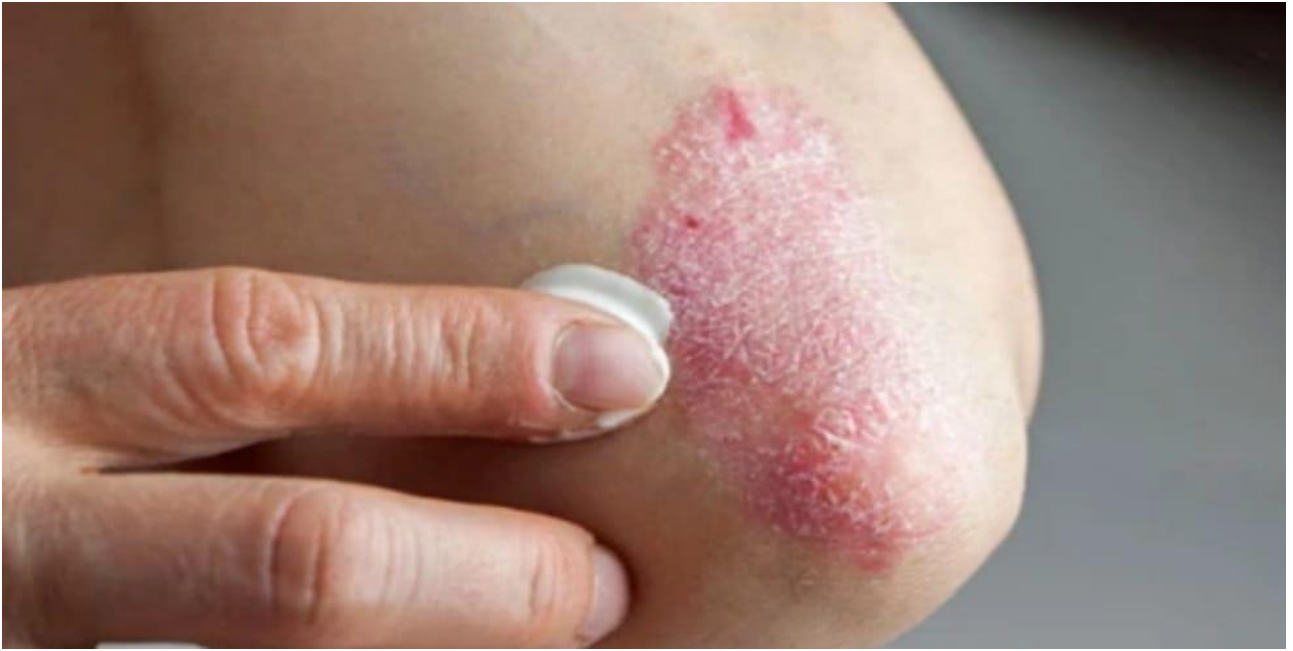
Atopik dermatit (egzama)

Her alerjik hastalık atopik değildir. Başlıca atopik hastalıklar, atopik dermatit, astım ve alerjik rinittir.