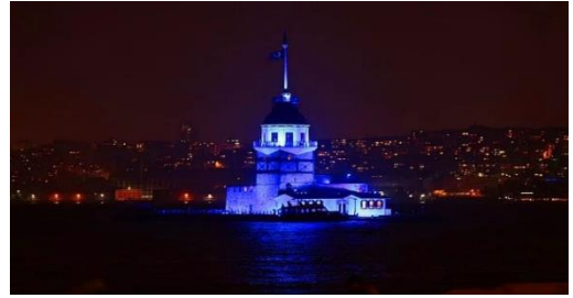
İstanbul Kız Kulesi

Toplumun dikkatini otizme çekmek için başlatılan ve tüm dünyada ilgi gören Otizme “Mavi Işık Yak” (Light It Up Blue) bugüne özel düzenlenen etkinlikler içerisinde yer alır. Farklı ülkeler kendileri için simge haline gelen yerleri mavi ışık ile ışıklandırarak herkesin izlemesine olanak sağlarken, sadece izlemekle yetinmeyip, etkinliklere katılımları ile destek veren etrafı maviye boyayan ve mavi balonları gökyüzüne salan bizler, diğer aylar içerisinde de gerçekten otizmin farkında mıydık?