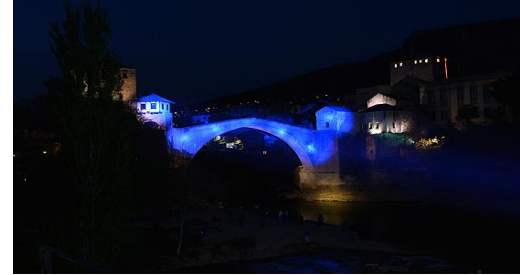
Bosna Hersek Mostar Köprüsü