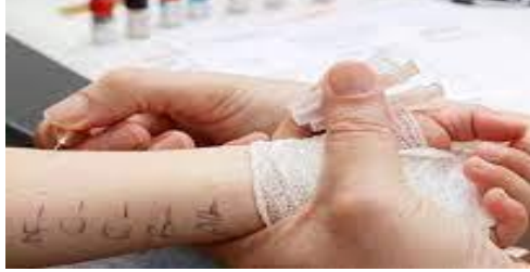
Deri prick testi

semptomatik tedaviye yanıt etkili değilse spesifik immuno terapi (aşı ) tedavisi uygulanabilir.Bu tedavi yöntemi ile alerjen maddeler belirli aralıklar ve artan dozlarda cilt altına enjekte edilerek kişinin bu alerjilere alıştırılması sağlanır.