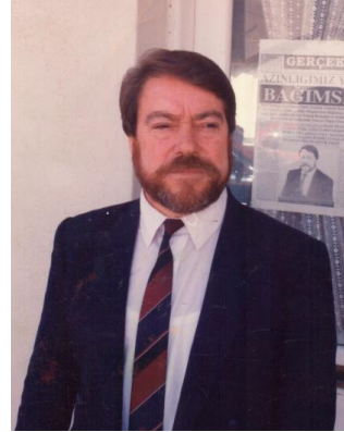
Milletvekili olma yolunda