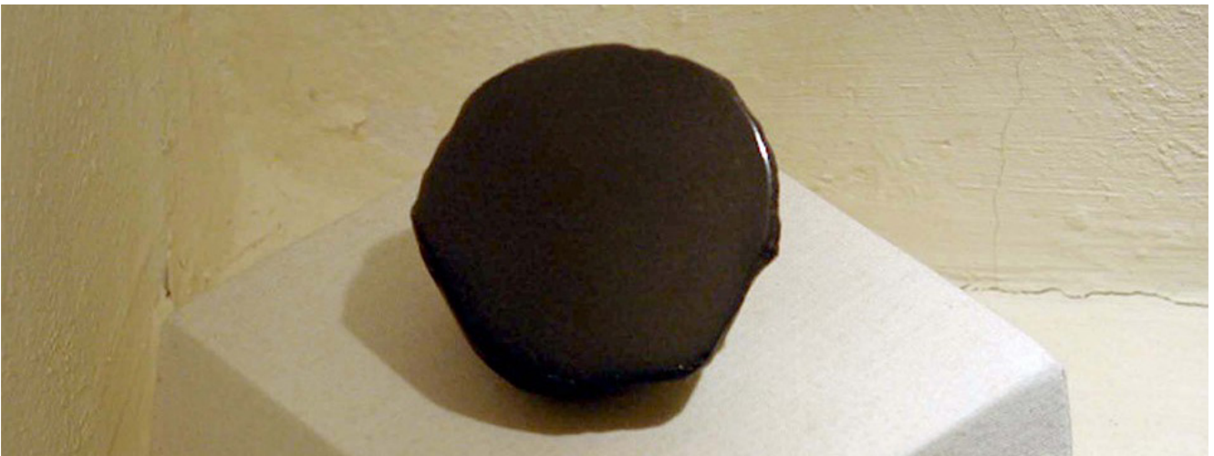
6. Yüzyıl ile tarihlendirilen obsidyen ayna. Anadolu Medeniyetleri Müzesinde sergilenmekte

Bazı kültürlerde korku, bazı kültürlerde ise saygı göstergesi olan aynalar, bilime de pek çok katkı sağlamıştır. İtalyan mimar ve mühendis Filippo Brunelleschi ayna kullanarak gerçekleştirdiği denemelerle perspektifi keşfetmiştir ve bu keşfin gerek mimariye gerekse resim