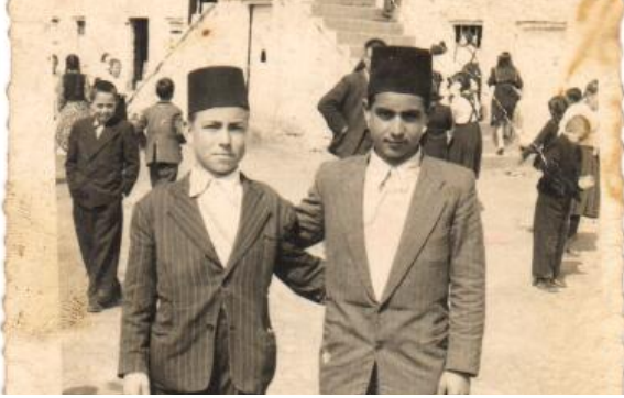
Mastanlı İlkokulu, 1957

Bizim hikayemiz ise 1970 yılında başladı. 1 Eylül'de nişanlanıp 11 Ekim'de evlendik. 1976 yılında kızımız Sevda dünyaya geldi, 1981 yılında kızımız Sevgi ile ikinci kez anne-baba olduk. 50 yıl boyunca bir yastığa baş koyarak çok mutlu bir hayat sürdürdük.