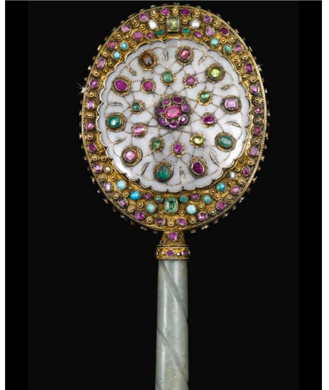
18. Yüzyıl, Osmanlı Dönemi el aynası