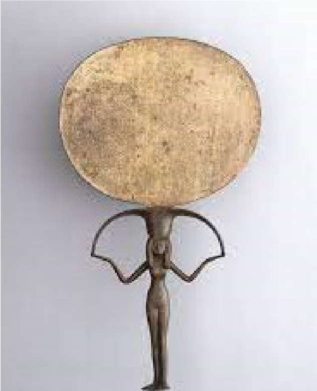
M.Ö 1500, antik Mısır aynası. New York Brooklyn Müzesi'nde sergileniyor.

Son söz olarak aynalar; insanlık tarihinde, önce yansıtıcı özelliği olan nesnelere, keşfedilmesiyle birlikte de ilkellerinden başlayıp modernlerine kadar olan tüm çeşitleri ile büyük önem taşımıştır ve neredeyse insanlık tarihi kadar eski bir geçmişe sahiptir. İnsanoğlu, kendini yansımından tanıyan nadir canlı türlerinden olduğu için aynaya büyük önem vermiştir. Günümüzde de pek çoğumuzun vazgeçilmez olarak gördüğü yagane nesnelere başında gelen ayna, tarih yolculuğunda kuşkusuz biz insanlar için önemli bir öğe olarak kendine yer etmeye devam edecektir.