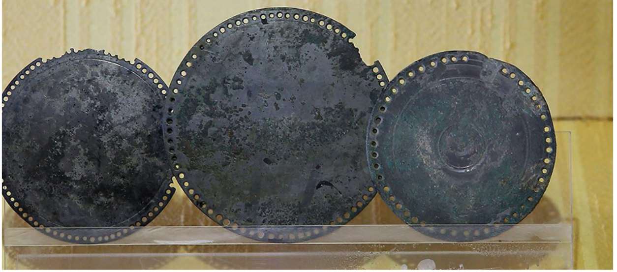
Pamukkale'de Hierapolis antik kentinde bulunan bronz aynalar.