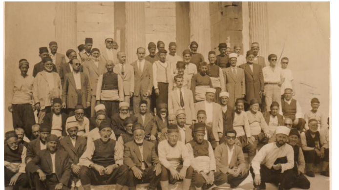
1958-Hacı kaflesi ile Medine'ye yolculuk

Sizinle bir anımızı paylaşmak istiyorum,